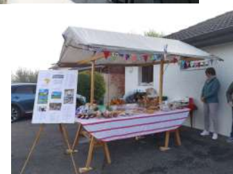
Petit-déjeuner mission, Courgenay