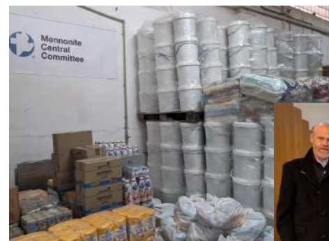
Action pour l'Ukraine avec MCC